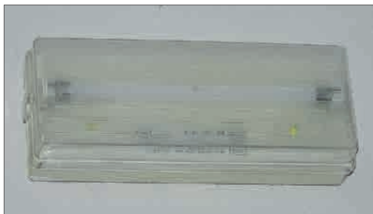
Nejčastější a nejpřísnější jsou kontroly nouzového osvětlení. Revizní zpráva je extra zvlášť podrobná. Na snímcích je vidět rozdíl ve funkčnosti zdrojů.

také výsledky naměřených hodnot uzemnění svodů.