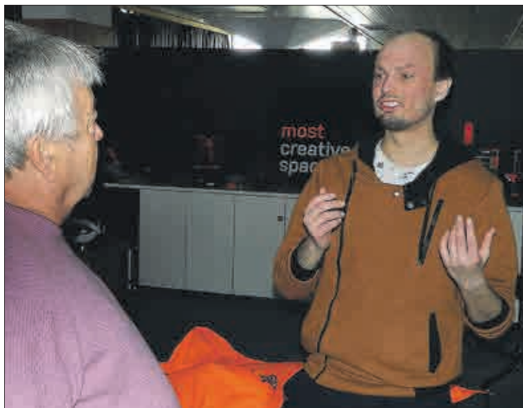
Byl i čas promluvit o práci na programu připomínajícím zaniklé město.

v kostele návštěvníkům promítají, ale je i dostupný na YouTube. Tvůrčí tým o filmu Národního památkového ústavu dobře ví a uvažuje o jeho možném využití do budoucna také v plánované expozici.