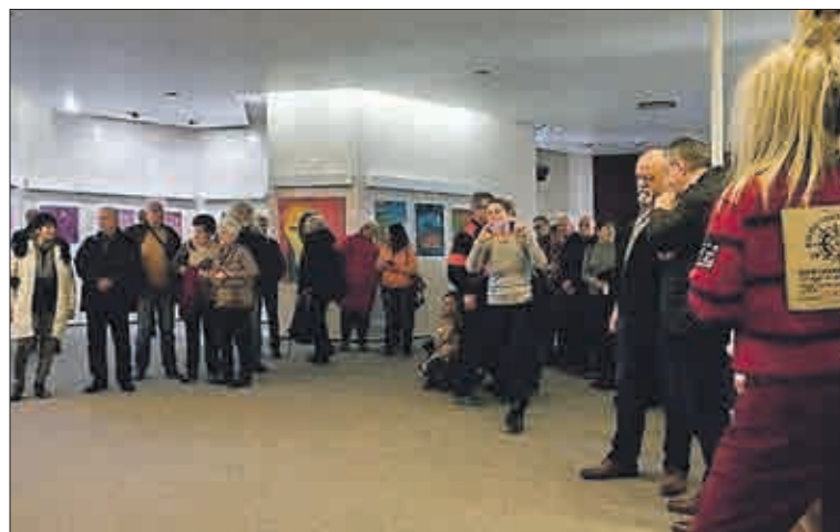
Na vernisáži bylo vidět překvapivě hodně zájemců o seznámení se s autorovou tvorbou.

rozměrnou tvorbu objektů a plastik. V jeho tvorbě je cosi až dráždivě a provokativně surreálního, což vyjadřuje jednu figurativně, jindy nefigurativně. Zaujme vás jeho zanícený zápal, s nímž se zmocňuje neobvyklých řešení své životní problematiky. Musíme obdivovat jeho úsilí, jež ho vede k tak rozmanitému výtvarnému vyjádření.