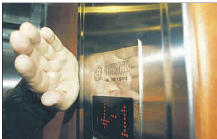
Trvalá památka na zhotovitele.