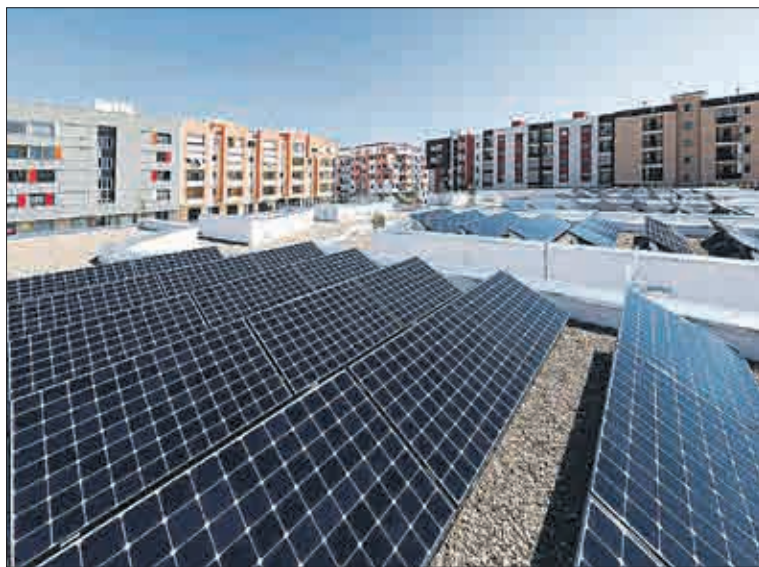
Fotovoltaické panely na střechách bytových domů už nejsou ničím výjimečným.

místa pro všechny bydlící. Nyní je to tak – jak jsme již zmínili –, že každý byt má své odběrné místo, jehož existence je garantována smlouvou bydlícího s jeho nynějším dodavatelem energie. Když si bydlící postaví hlavu, jednotné odběrné místo nevznikne a „jednotná“ elektřina tak nebude moci proudit z FVE do domácností. Družstvo ani funkcionáři výborů nemají žádné páky na to, aby nesouhlasícího bydlícího přiměli ke změně jeho postoje. Bylo by proto vhodné, aby se členové výborů SA a domovních výborů SVJ obraceli v záležitosti možného vybudování FVE současně s JOM na techniky družstva jen tehdy, když budou mít stoprocentní jistotu, že všichni obyvatelé domu s tímto záměrem souhlasí.