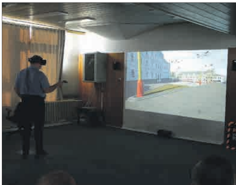
Stačí nasadit virtuální brýle a procházka po starém Mostě může začít.