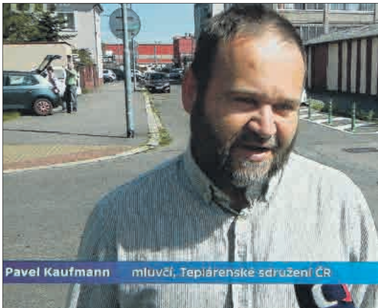
O poznatcích z topné sezony 2022/2023 pohovořil v pořadu Události v regionech (ČT1) mluvčí Teplárenského sdružení České republiky.