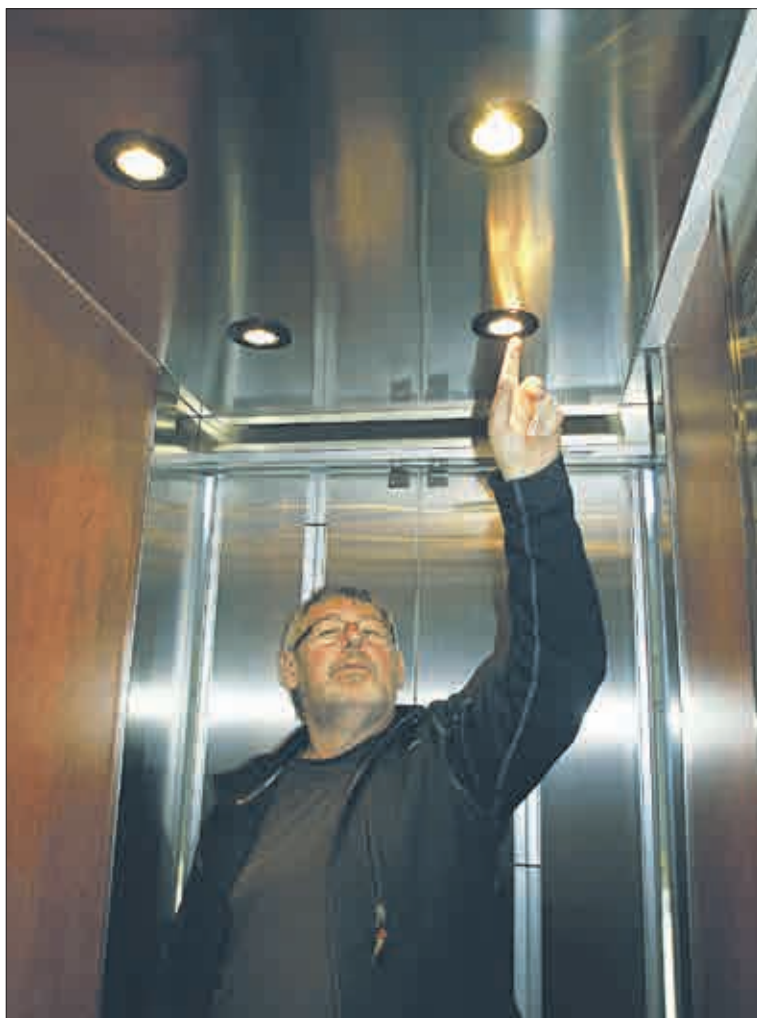
Výtahová klec má bodové osvětlení.

vám šli pomoci. To už je hudba minulosti. V kleci je totiž telefon, takže stačí zmáčknout příslušné tlačítko, přístroj automaticky vytočí telefonní číslo na havarijní dispečerku, ta se vám ozve, vy ji přes instalovaný mikrofon vysvětlíte důvod vašeho volání a přítom si ani nemusíte pamatovat, v jakém jste bloku. Dispečerka totiž vidí na displeji či monitoru odkud voláte – každý telefonní přístroj má specifické identifikační znaky, takže havarijní služba firmy Hasman-Výtahy přesně ví, k jakému domu má vyjet a do kterého vchodu vstoupit. Vyproštění z výtahu se tak dočkáte daleko dříve, než tomu bylo v případě starých a poruchových výtahů. Proběhne daleko kulturněji.