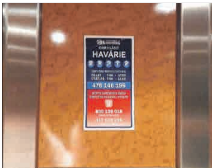
V kabině nechybí písemné upozornění na to, jak řešit případnou nouzovou situaci. Nastat může, i když si ji nikdo nepřeje.