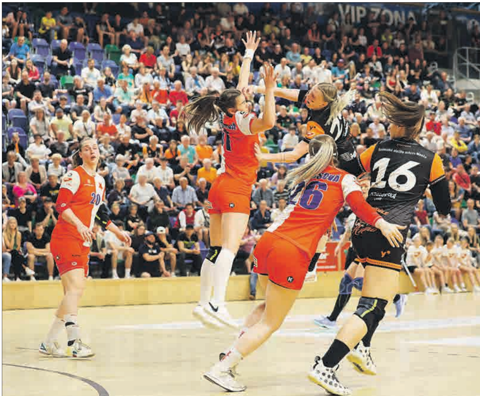
Černí andělé se snažili na domácí palubovce vyhrát, ale jejich úsilí tentokrát nebylo korunováno úspěchem. Slavia projevila sílu – fyzickou i morální.