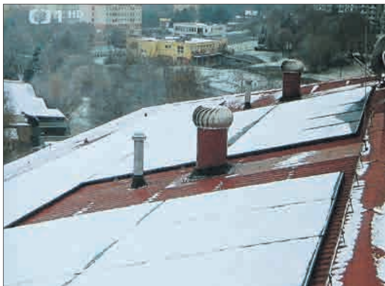
Fotovoltaické panely instalované na střeše paneláku v Hamerské ulici č.p. 328-329 v litvínovském Janově.