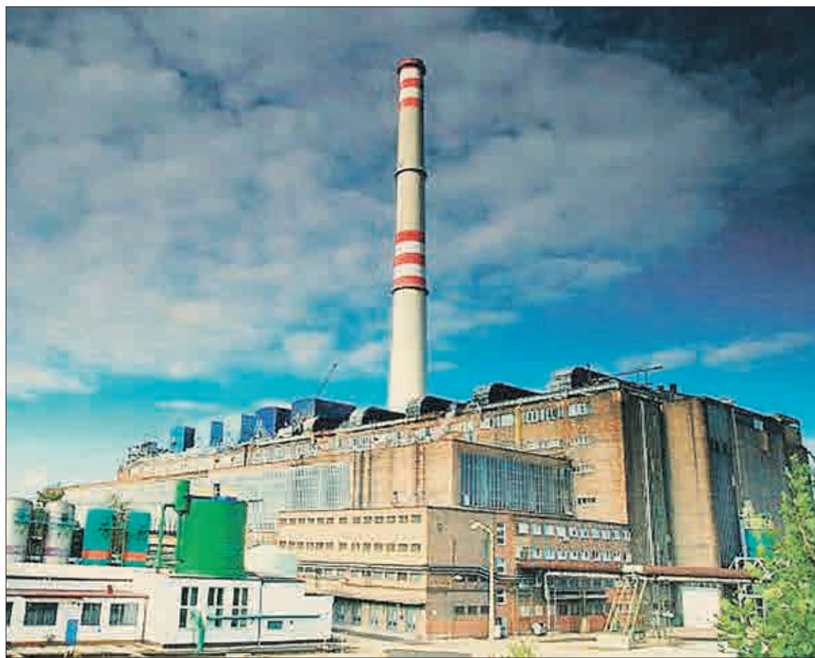
Výrobce tepla United Energy (UE) a dodavatel média Severočeská teplárenská (ST) rozvíjejí svoji činnost takřkajíc pod jednou střechou – v průmyslovém areálu v Mostě-Komořanech.

■ čtvrť Výsluní – tady bude čekat bydlicí ještě jedna krátkodobá