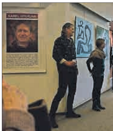
Informaci o autorovi bylo na vernisáži i v průběhu celé výstavy docela dost. Kdo chtěl vědět, dozvěděl se.