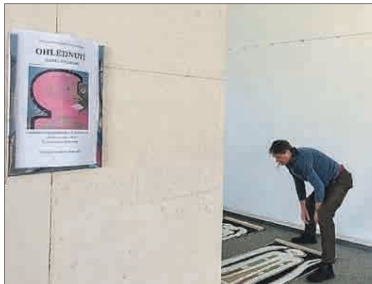
Obličej na plakátu (vlevo) je více optimistický než obličej skutečného tvůrce skloněného nad podlahou. Přemítání o pořadí obrazů dá zabrat.