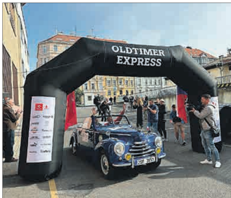
Start v Praze před Národním technickým muzeem.