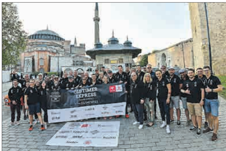
Účastníci jízdy plní radosti, že všichni dojeli.