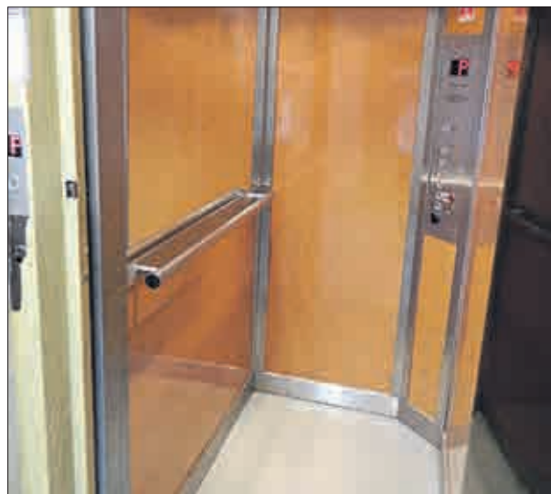
Také estetický vzhled kabin a jejich vybavení je odlišné a postupně se vyvíjí v toku času a vývoje techniky.