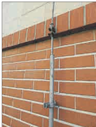
Vizuálně musí být hromosvod zkontrolován po celé své délce každoročně a revizní zpráva se zabývá i popisem úchytlů.