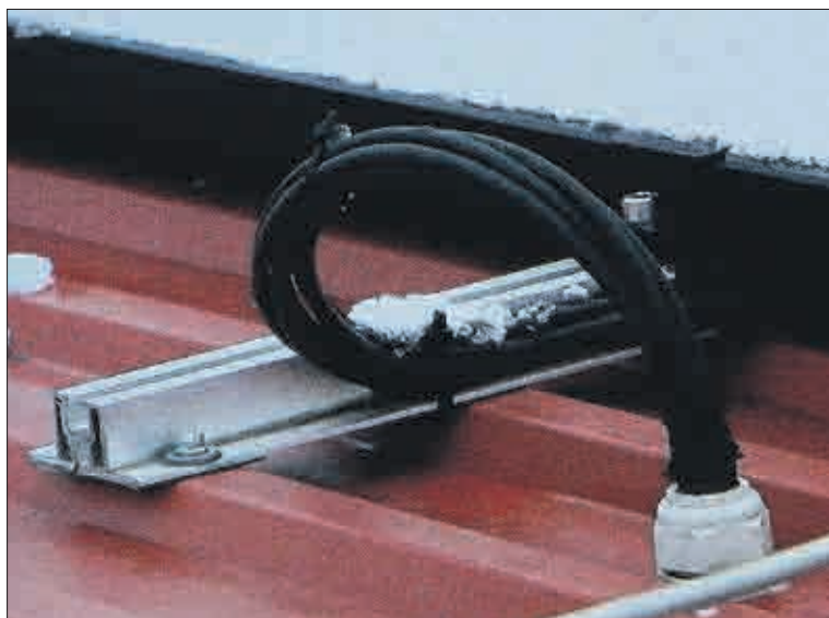
Litvínov-Janov, Hamerská č.p. 328-329: Takto vypadá kabel přenášející energii z fotovoltaických panelů do strojovny domu.