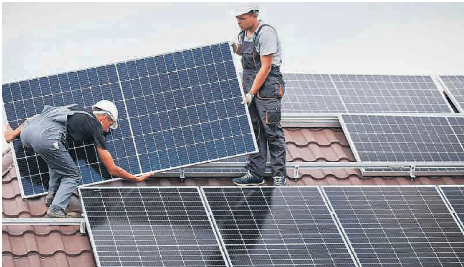
Fotovoltaické elektrárny jsou čím dál oblíbenější. Lidé z firem, které se zabývají fotovoltaikou, se musejí pořádně ohánět.

Technik tím naznačil, že může vzniknout problém s vyslovením nesouhlasu výše popsaného postupu v případě některých bydlicích. Ti nemusejí souhlasit se vznikem jednotného odběrného