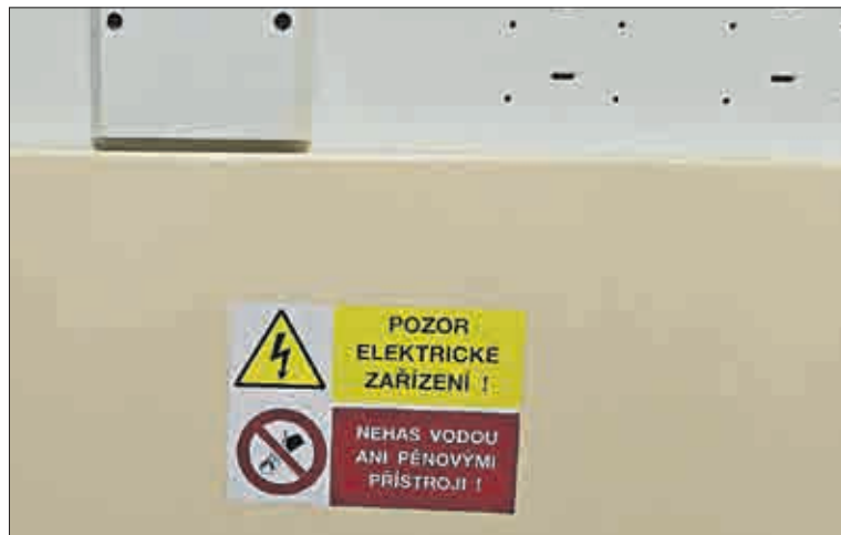
Revize elektrozařízení probíhá v pevně stanovených lhůtách, které nesmějí být porušovány. V sázce je mimo jiné i zdraví či život člověka.