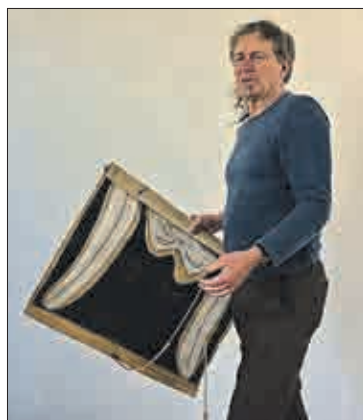
Tak kam s ním? Kam ho pověsit? Které místo bude pro něj nejvhodnější, nejlepší?