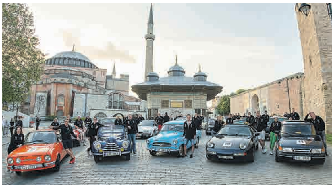
České historické vozy před mešitou Hagia Sophia.