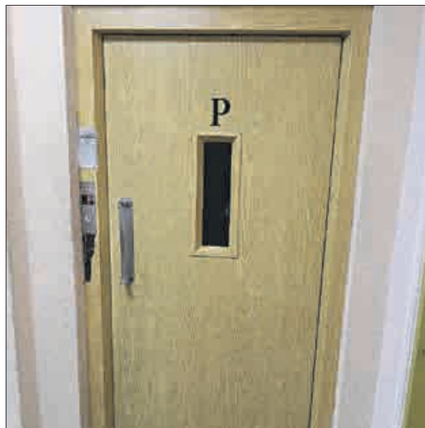
Výtahy v našich domech jsou různého stáří. Tento patří mezi mladší, byť mladíkem už dávno není.