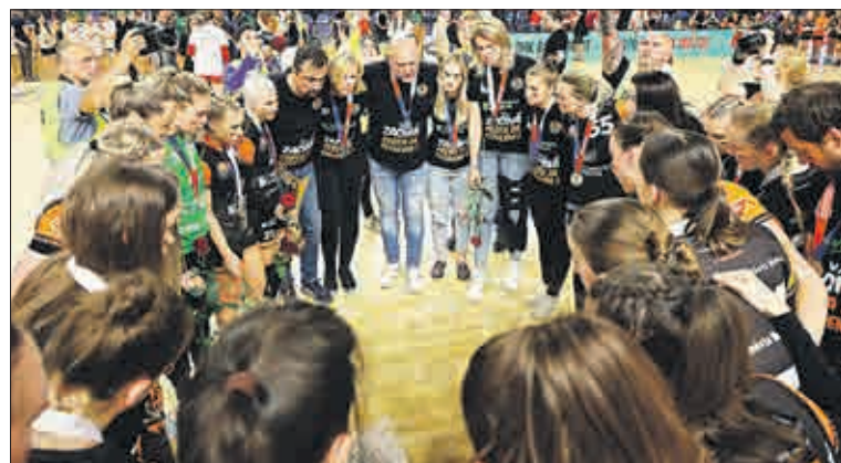
Kolektiv hráček a realizační tým DHK Baník Most se rozloučil se sezonou 2022/2023 v tričkách s optimistickým sdělením „Začíná cesta za titulem.“ V nastávající sezoně 2023/2024 držíme palce!