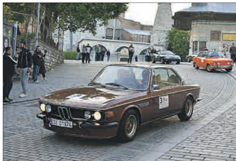
Vozy urazily cestu dlouhou 2 200 kilometrů.

Text: Radek LAUBE