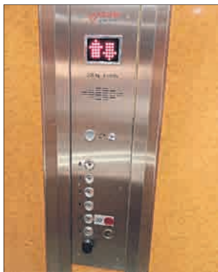
Ovládací panel v kabině. Někde je jednodušší, jinde zase krásnější, zde nablýskanější.