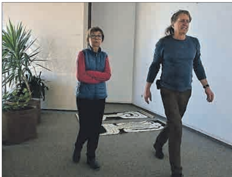
Výraz v obličeji to říká zcela jasně: Připravit výstavu je pořádná fuška! Člověk se přitom pořádně nachodí sem a tam.