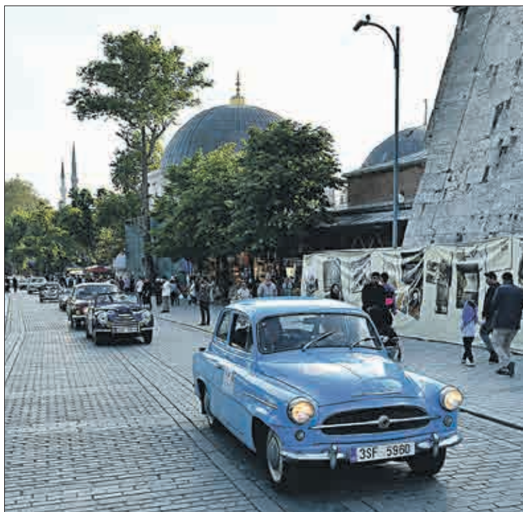
Kolona vozů veteránů poutala pozornost chodců.

pomohli tento bláznivý nápad proměnit ve skutečnost.“