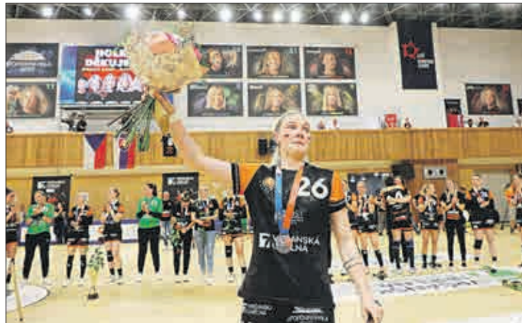
Černí andělé poděkovali fanouškům za jejich přízeň. Ti během zápasu vytvořili mohutnou zvukovou kulisu. Dobře ji bylo slyšet i v přenosu ČT sport.