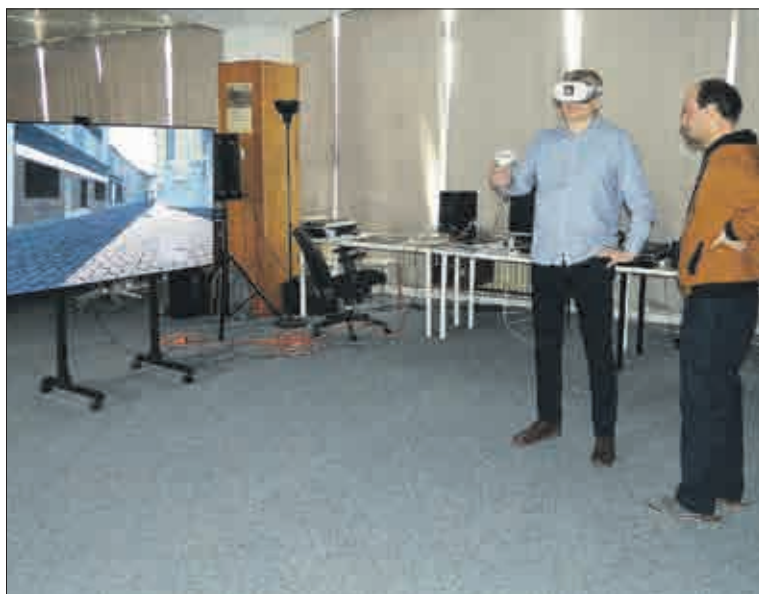
Pro velký zájem z řad účastníků bylo možno použít i druhé virtuální brýle.