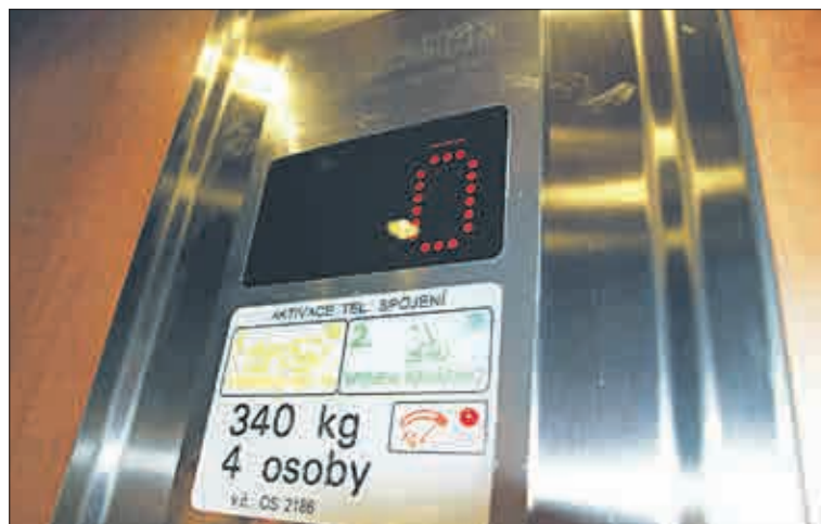
Pomoc v nouzi – automatické telefonní spojení.

„Nejpracnější byla ta ocelová konstrukce. Práce komplikovala nekvalitní práce stavbařů z doby, kdy byl panelák postaven. Podívejte se, jak je to tady všechno